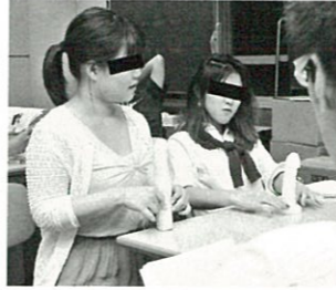
ペニス模型を吟味する一般女性

男性器の実力は長さよりも太さ! 約2万人の実績と信頼ある名医があなたのペニスを理想のモノに!